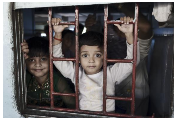
2012. XLIII Premio Ciudad de Alcalá. Finalista: Exposición y catálogo.