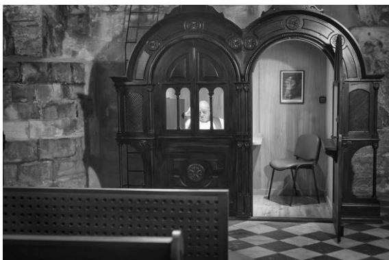
2014. Concurso Tolosa Herra. Seleccionado: Exposición y Catálogo.