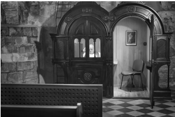
2014. Concurso Tolosa Herra. Seleccionado: Exposición y Catálogo.