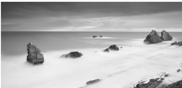
2015. I Certamen Photoclub de fotografía panorámica. Finalista.