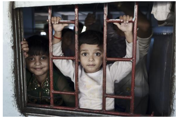
2012. XLIII Premio Ciudad de Alcalá. Finalista: Exposición y catálogo.